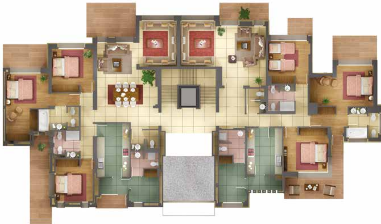
1 er Étage E