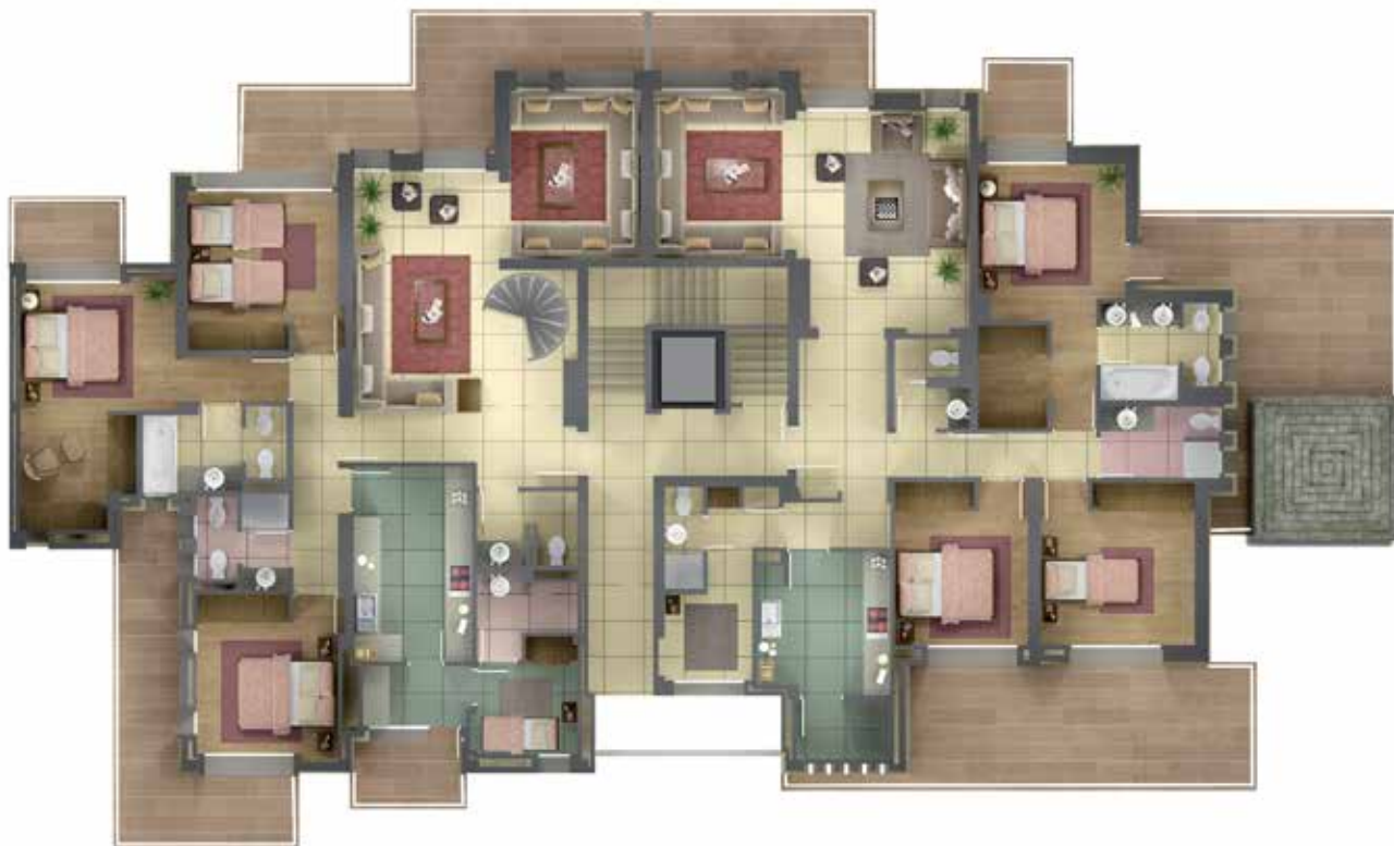
2 ème Étage I