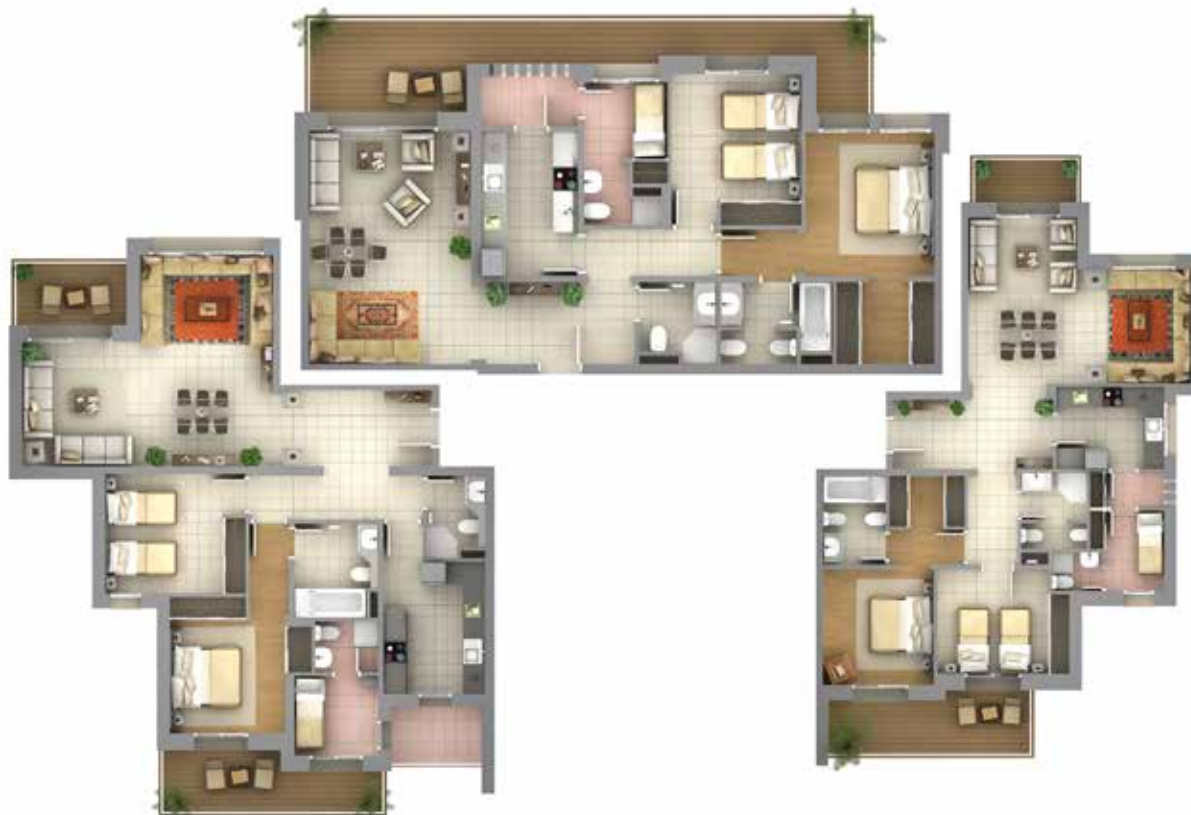
2 ème Étage 7