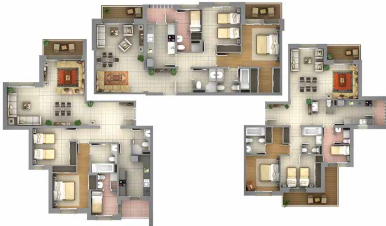
1 er Étage 4