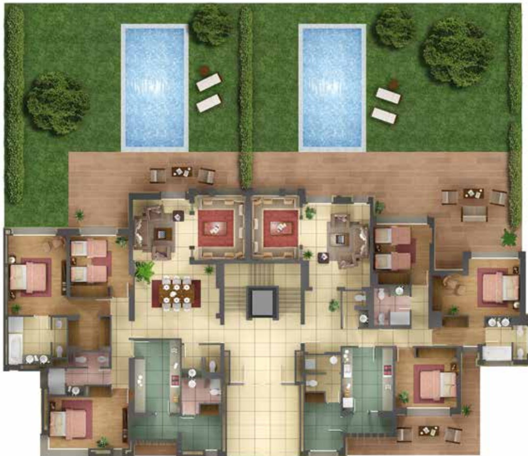
Rez - de - chaussée A