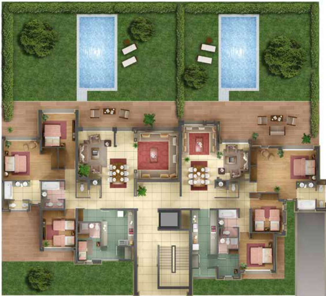
Rez - de - chaussée A